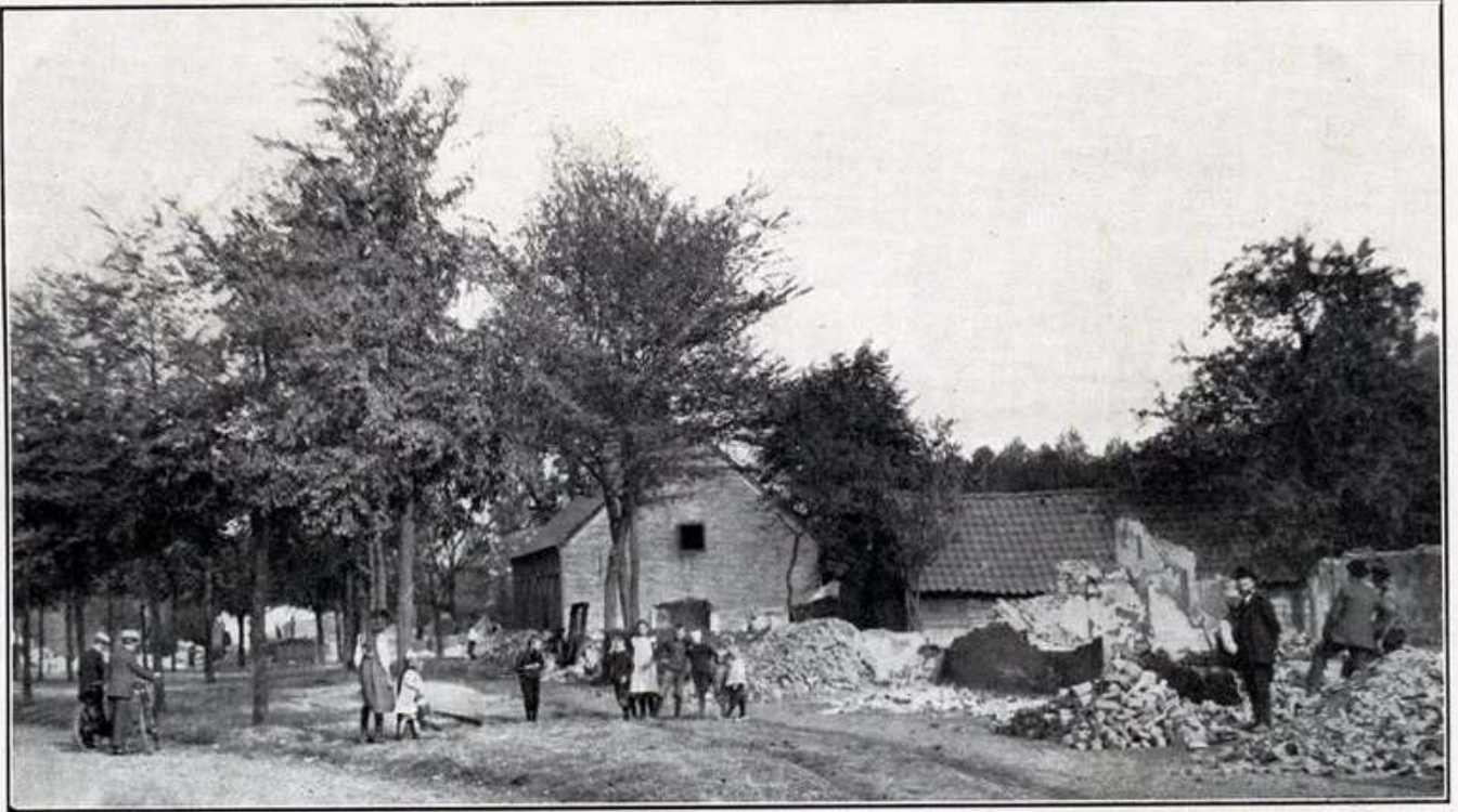
BRAND TE MIERLO OP 27 AUGUSTUS 1921.

de bewoners die door de brand waren getroffen. Deze slachtoffers van de ramp laadden hun geredde inboedel op karren en kruitwagens en trokken met hun vee naar de Wilhelminastraat.