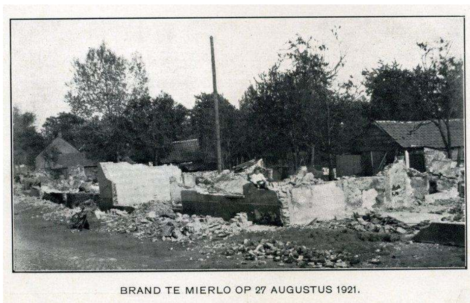
De trieste resten van een paar woningen na de grote brand.

Vrouwen met kleine kinderen en oude behoeftige mensen waren alleen thuis en raakten in paniek. Er werd hard geschreeuwd en veel gehuild. De kippen, varkens en geiten maakten een enorm kabaal. Meubels werden op straat en in de tuin gezet, maar ook daar was het niet veilig. Door de grote hitte en het rondvliegend brandend stro werd ook daar nog veel meubilair vernietigd.