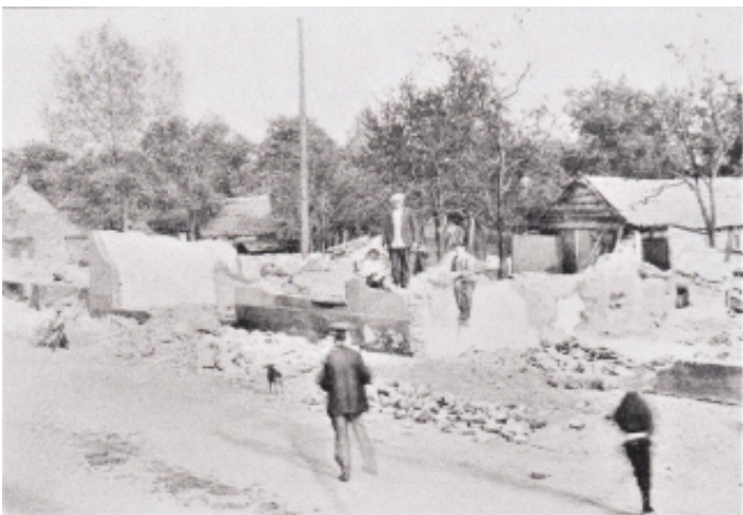
De ruïnes na de brand bleven publiek trekken.

Ongetwijfeld zullen de mensen die bij de firma Ign. De Haes en bij Swinkels in de Brugstraat werkten de brand snel opgemerkt hebben. In die tijd was er nauwelijks bebouwing tussen de fabrieken en de brandende huizen. Zij snelden toe, maar ook zij konden weinig doen. Beide textielondernemers - W. Swinkels en Ign. de Haes - waren erg begaan met het lot van de slachtoffers en zij waren een van de eersten die met een grote gift hulp boden.