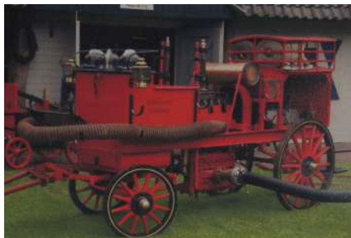
De Helmondse motorspuit die in 1921 hulp verleende bij de brand.