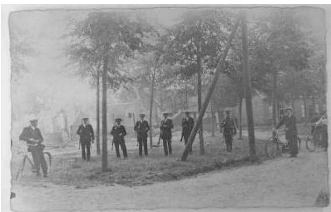
Kort na de 1e wereldoorlog werden de Burgerwacht en Landstorm opgericht. Aangezien de personen op deze foto wapens dragen, zal het gaan om de Landstorm.

Beide groepen waren na de 1e Wereldoorlog opgericht om, op verzoek van de plaatselijke overheid,